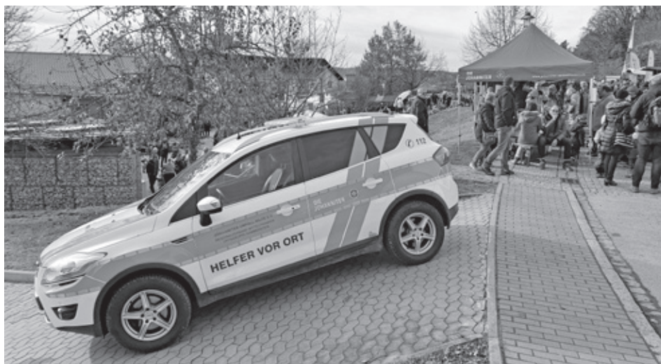
Auch auf dem Waldmarkt waren die Johanniter im Einsatz.

Doch die meisten Fahrten führten in die Kammersteiner Orte und hier sind die Ersthelfer dem Rettungsdienst in der Regel deutlich voraus. Aktuell besteht das Team aus zwölf Aktiven, die von Haag über Götzenreuth, Barthelmesaurach und Günzersreuth bis Kammerstein