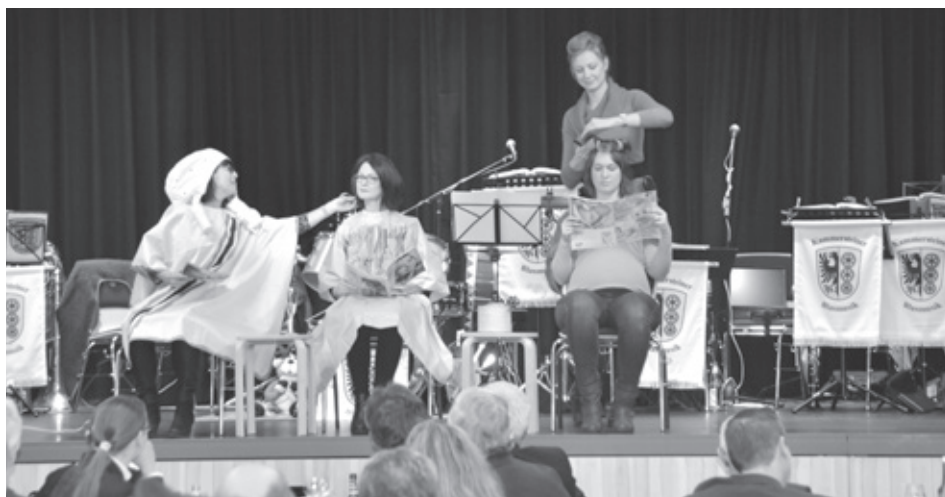
Die Theatergruppe Kammerstein ernte viel Applaus für ihre Darbietung.