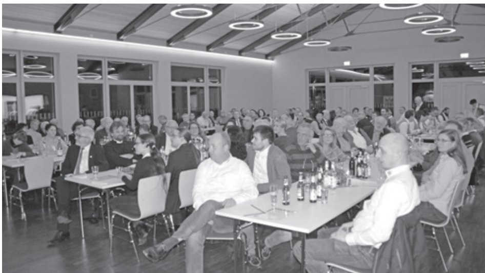
Bei der Einweihung des Bürgerhauses war der große Saal voll besetzt.

Vereins- und Wirtshaussterben entgegenzuwirken“, so das Gemeindeoberhaupt weiter. „Das Miteinander braucht Räume!“