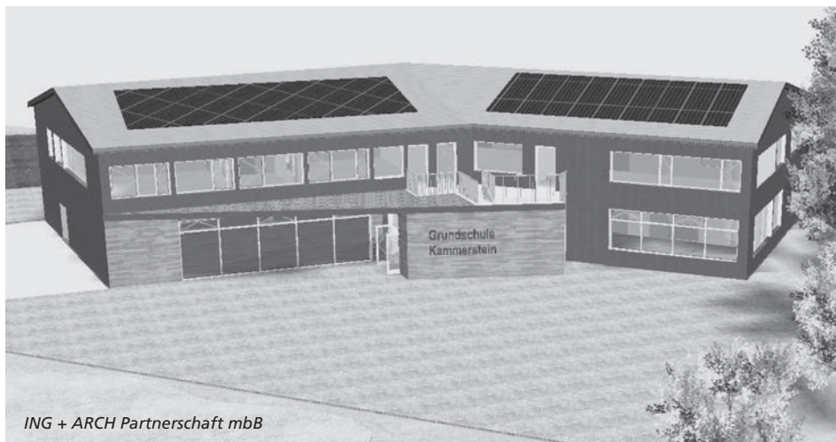
ING + ARCH Partnerschaft mbB