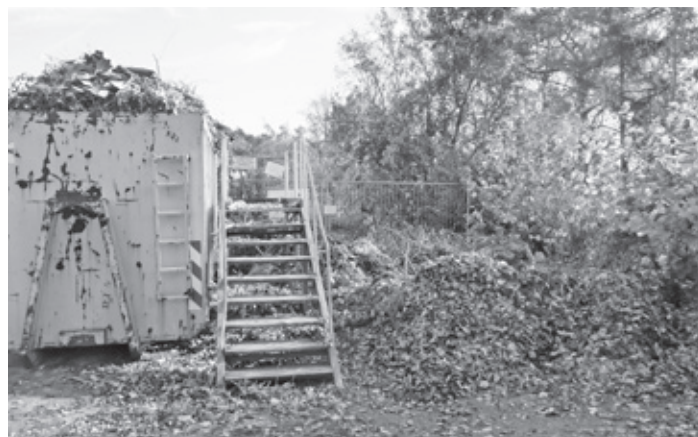
Solche Situationen können mit Hilfe von „Grüngutcontainer-Paten“ vermieden werden.

Immer wieder kommt es vor, dass Gartenabfälle aufgrund voller Container einfach daneben abgelegt werden. Damit dies möglichst vermieden wird, sucht die Gemeinde Kammerstein für alle Grüngutcontainer sogenannte „Paten“, die die Standorte immer wieder überprüfen und die Firma Hofmann in Büchenbach benachrichtigen, wenn ein Container überfüllt oder der Standort verschmutzt ist. Die Firma Hofmann hat selbstverständlich einen Leerungsrhythmus und kommt auch ohne Benachrichtigung in regelmäßigen Abständen, um die Container zu leeren.