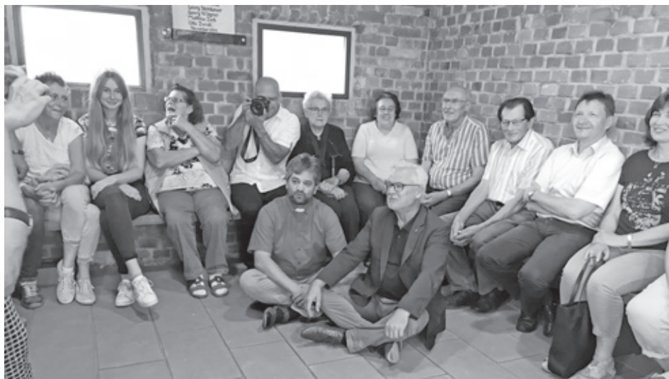
Groß ist die Kapelle im Herzen von Rudelsdorf wahrlich nicht. So mussten die Teilnehmer an der Übergabefeier dicht gedrängt und teilweise auch auf dem Fußboden sitzen.