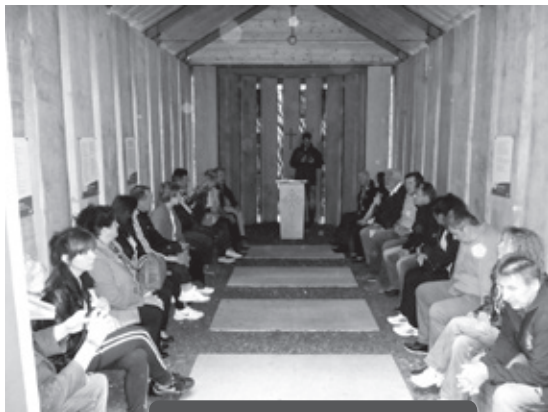
Die Jakobuskapelle im Heidenberg lädt zum Verweilen ein.