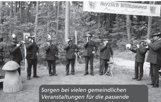
Sorgen bei vielen gemeindlichen Veranstaltungen für die passende musikalische Begleitung: Die Jagd- hornbläser Günzersreuth-Albersreuth.