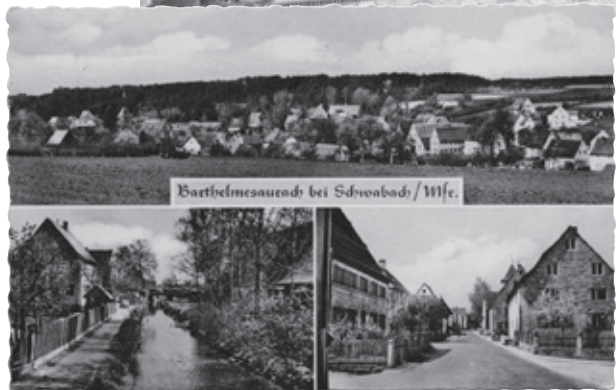
Barthelmesaurach bei Schwabach/Wfr.