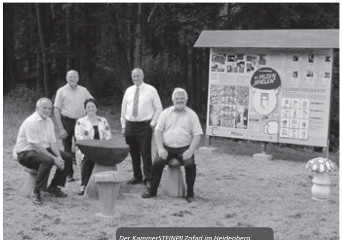
Der KammerSTEINPILZpfad im Heidenberg wurde 2014 eröffnet.

Das Bücherregal steht im Kammersteiner Kultur-Kasten am Rathausplatz und ist rund um die Uhr geöffnet.