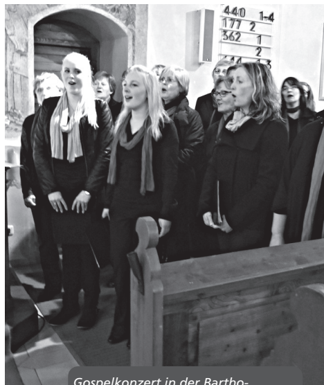
Gospelkonzert in der Bartholomäuskirche in Barthelmesaurach