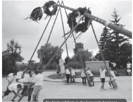
Die Kirchweihfeste in der Gemeinde beginnen. Die Günzersreuther Kerwaboum stellten im Jahr 2014 einen WM-Kerwaboum.