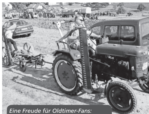
Eine Freude für Oldtimer-Fans: Das Ackerfest der Schlepperfreunde Oberreichenbach.

Heilsbronner Straße 3 91126 Kammerstein-Rudelsdorf Tel.: 0 98 71/3 68