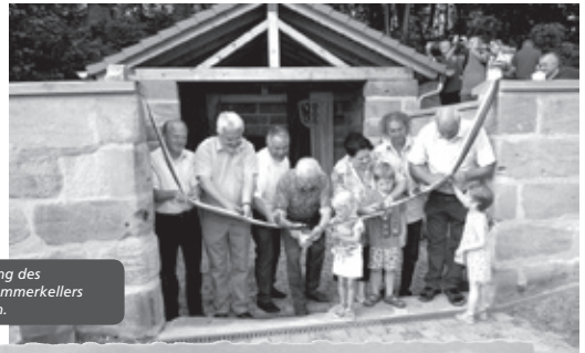
Feierliche Einweihung des traditionsreichen Sommerkellers in Barthelmesaurach.