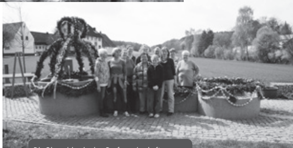
Die Oberreichenbacher Dorfgemeinschaft schmückt jedes Jahr liebevoll ihren Osterbrunnen.