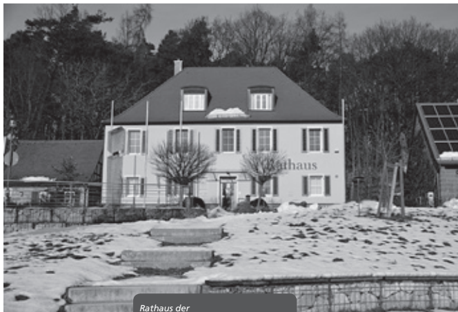
Rathaus der Gemeinde Kammerstein.

Sa., 31.01., 20:00 Uhr Faschingsball SV Kammerstein Sporthalle des SV Kammerstein