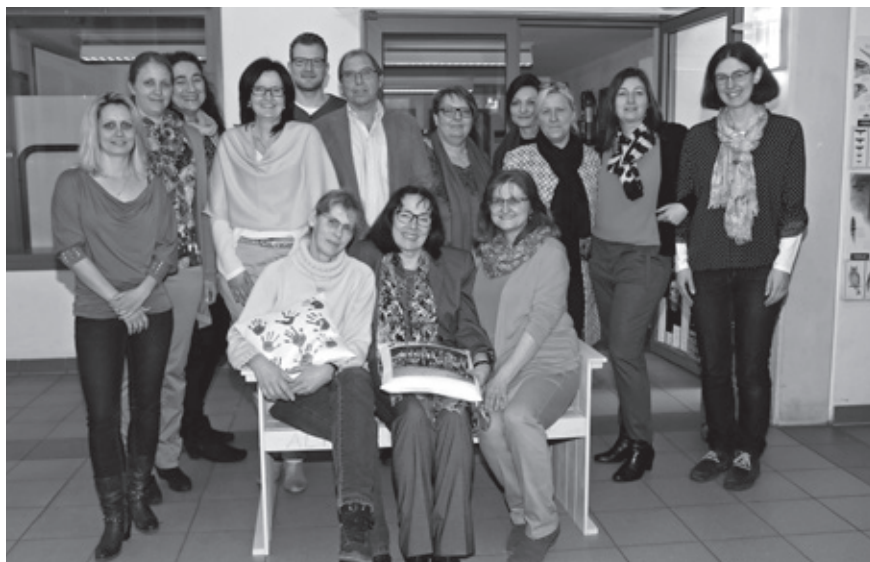
Erinnerungsfoto mit ihrem Lehrer-Kollegium.