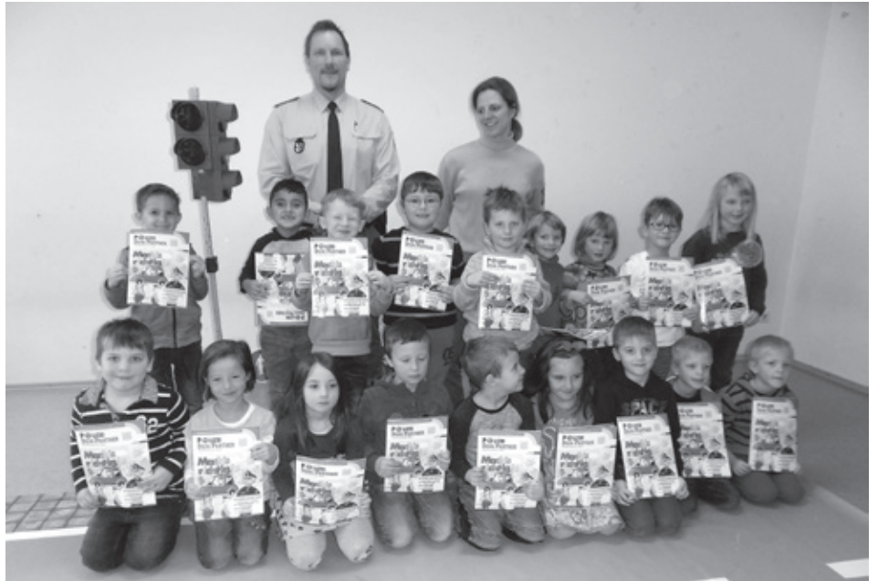
Die Sonnenstrahlen- und Regenbogenkinder mit den Verkehrserziehern.

Bei dieser Aktion hatten alle großen Spaß und ein Wiedersehen mit den Verkehrserziehern wird im Sommer am Verkehrsübungsplatz sein.