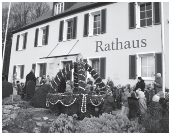
Vor dem Rathaus gibt es auch 2017 einen geschmückten Osterbrunnen.

Eier, Wasser und frisches Grün sind Symbole für das wieder hervorkommende Leben im Frühling. Neben dem Erwachen der Natur steht der Brauch des Osterbrunnens auch als Sinnbild für die Auferstehung Jesu Christi. Die geschmückten Brunnen werden je nach Wetterlage etwa zwei Wochen lang zu besichtigen sein.