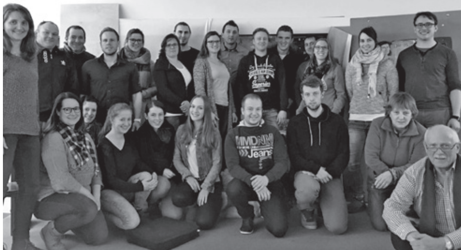
Vertreter der Jugendgruppen trafen sich zum Gedankenaustausch.

Bei einer gemütlichen, deftigen Brotzeit in lockerer Runde, informierten die Jugendbeauftragten zu verschiedenen Themen wie beispielsweise dem Projekt „Jugendzukunftswerkstatt“, „Spiel ohne Grenzen“, eine Aktion im Rahmen des Ferienprogramms und eine angedachte „Drogenpräventionsveranstaltung“, welche