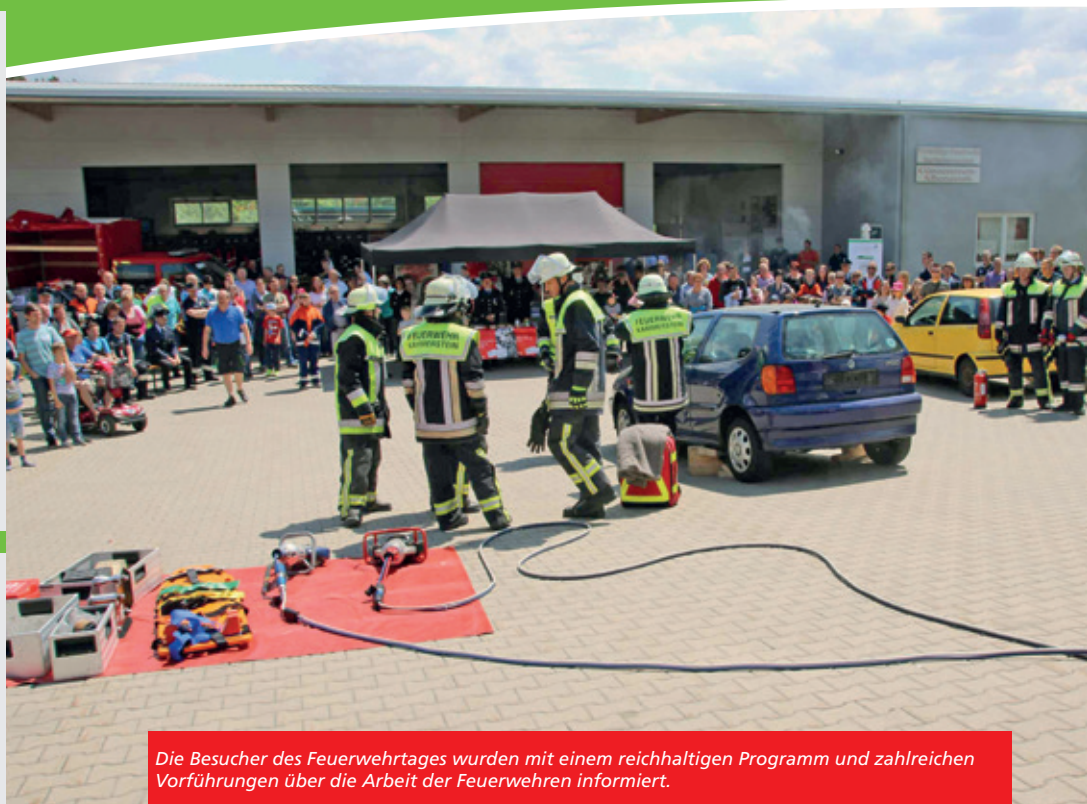
Die Besucher des Feuerwehrtages wurden mit einem reichhaltigen Programm und zahlreichen Vorführungen über die Arbeit der Feuerwehren informiert.