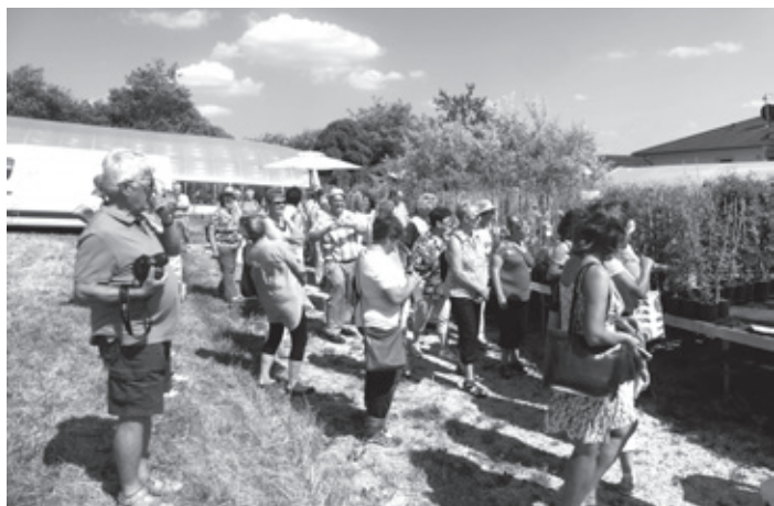
Der Gartenbauverein nach der Ankunft in der Staudengärtnerei Herian.