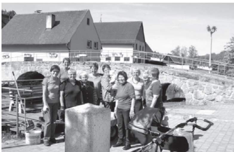
Einige fleißige Blumamadli nach der Pflanzaktion im Mai 2017.

In den Sommermonaten werden die Blumen jede Woche (Mai bis September) von je einer Frau oder Mann gegossen. Regelmäßig werden die Blumen auch von mehreren Frauen gepflegt und ausgezupft. Dies geschieht nach einem Gießplan, der jährlich erstellt wird.