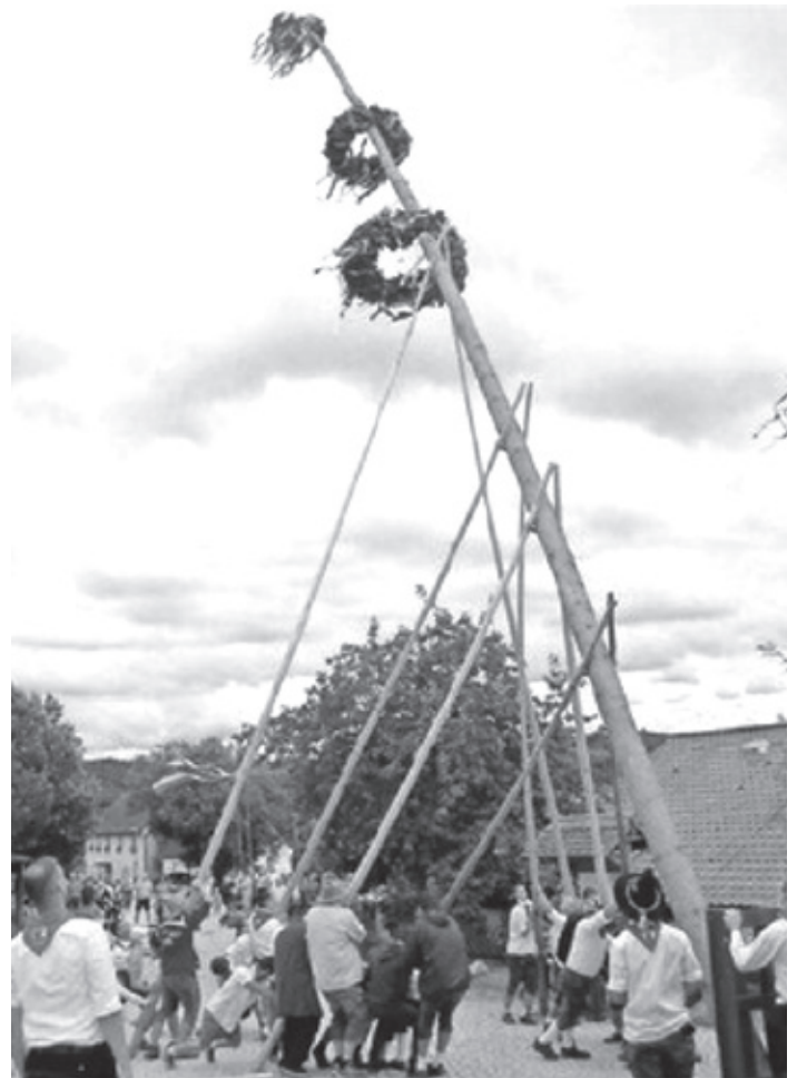
Kraftvoll und dennoch sensibel: Die Kammersteiner Kärwa-Boum beim Aufrichten des Baumes.