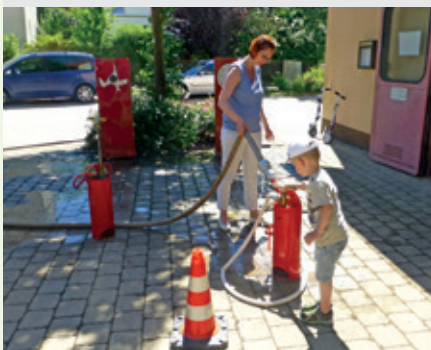
In Volkersgau durften sich schon die Jüngsten über die Arbeit der Feuerwehr informieren. Siehe Seite 17.