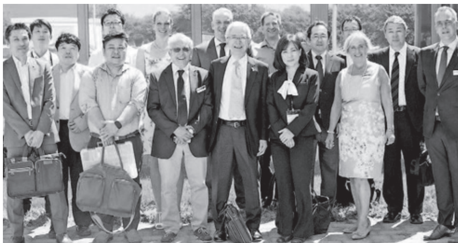
Besuch aus Japan bei WILAmEd in Barthelmesaurach: Eine Abordnung aus der Präfektur Saitama nutzte den Aufenthalt auf einer Fachmesse in Nürnberg zum Firmenbesuch.

Im Rahmen der Messe konnten internationale Gäste zudem ihren Aufenthalt nutzen, um in